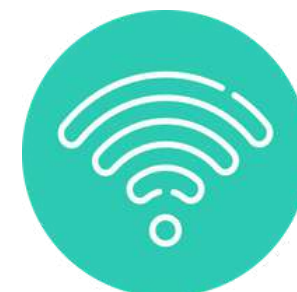
Fibre haut débit